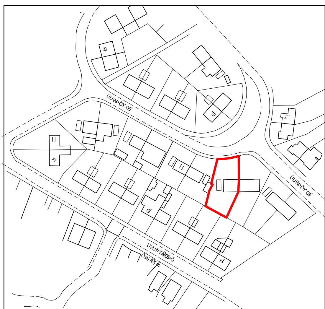
Š & cã } Á læ ÁFKG €D